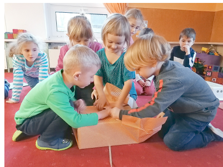
Bis bald, eure Pfiffikusse.

Das Kinderschloss sagt DANKE an: Familie Drewke für die großzügige Geldspende und an alle Eltern für die tolle Weihnachtsdeko. Wir wünschen Ihnen ein gesundes neues Jahr und hoffen, Sie hatten eine schöne Weihnachtszeit und erholsame Feiertage.