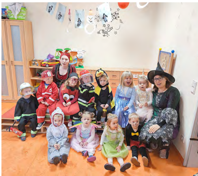
Alle Kinder präsentierten sich stolz in ihren hübschen Kostümen.