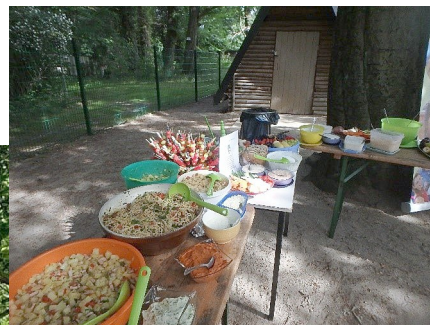
Gemeinsam reisten wir mit Unterstützung unserer Waldgeister (Vorschulkinder) ins Gesund-und-lecker-Land.