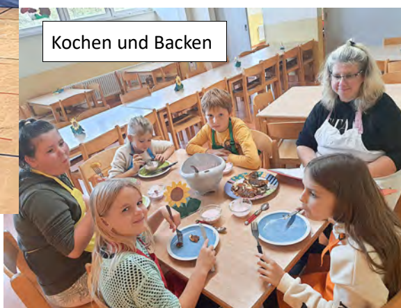
Kochen und Backen

Ein großes Dankeschön möchten wir den Verantwortlichen hiermit aussprechen.