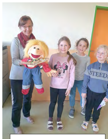
Theo der Bibelentdecker