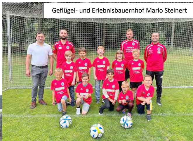
Geflügel- und Erlebnisbauernhof Mario Steinert

An dieser Stelle bedanken wir uns herzlichst bei unseren Sponsoren Geflügel- und Erlebnisbauernhof Mario Steinert sowie bei der Firma Ronald Halla – Fahrzeugteile- für die treue und großzügige Unterstützung der Fußball T-Shirts und des neuen Trikotsatzes für unsere F-Jugend Mannschaft.