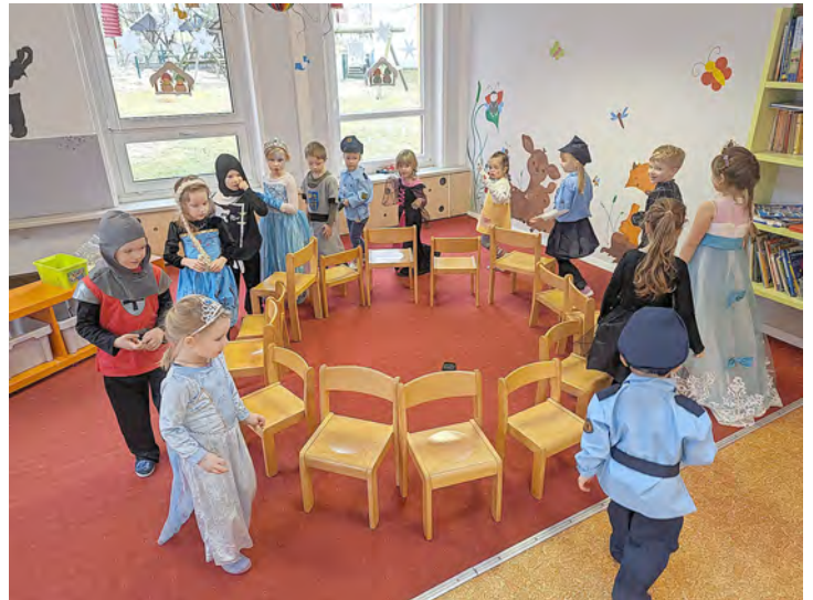
Bei toller Stimmung tanzten, sangen, tobten und genossen wir den Vormittag gemeinsam.