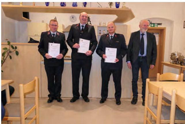
Gratulation zum bestandenen Lehrgang