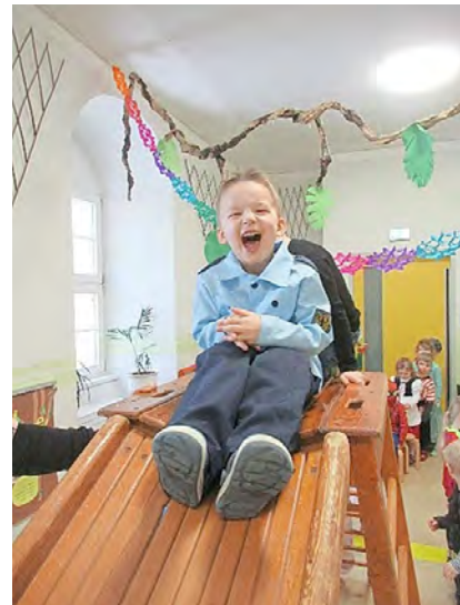
Mit viel Freude erlebten unsere Kinderschloss-Kinder 3 tolle Faschingstage mit Spiel, Spaß, Tanz, „Zamper-Tour“ und Spagetti essen mit Fingern.