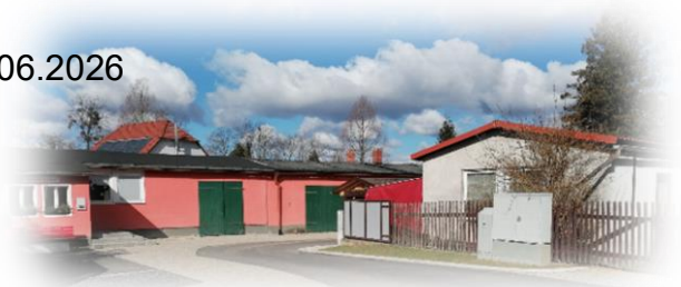
soziokulturelle Begegnungsstätte – Arnsdorfer Straße 100

Voraussichtliche Zuschlagserteilung bis 03.07.2026